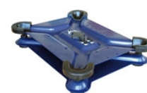
Konstrukce váhy WTC/C